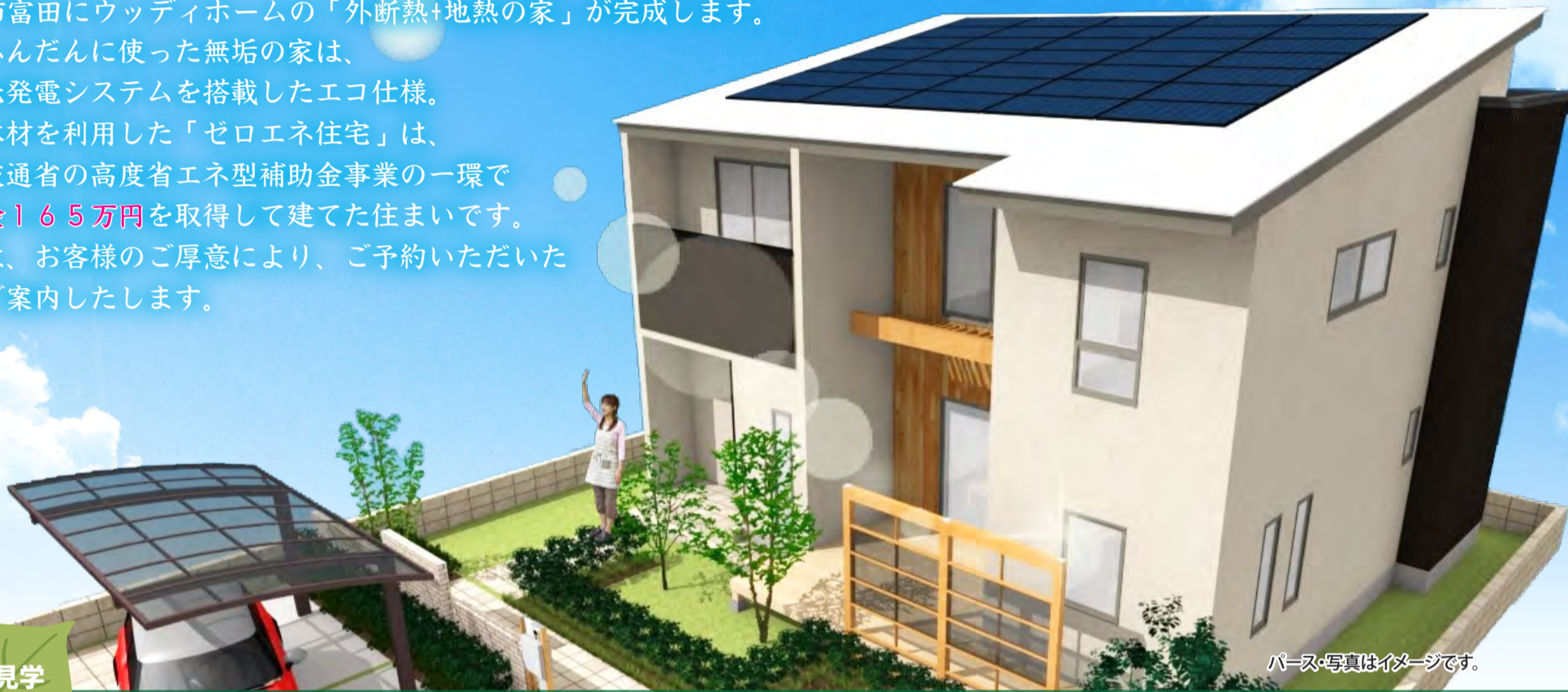
パース・写真はイメージです。

郡山市富田にウッディホームの「外断熱+地熱の家」が完成します。 木をふんだんに使った無垢の家は、 太陽光発電システムを搭載したエコ仕様。 県産木材を利用した「ゼロエネ住宅」は、 国土交通省の高度省エネ型補助金事業の一環で 補助金165万円 を取得して建てた住まいです。 今回は、お客様のご厚意により、ご予約いただいた 方をご案内いたします。